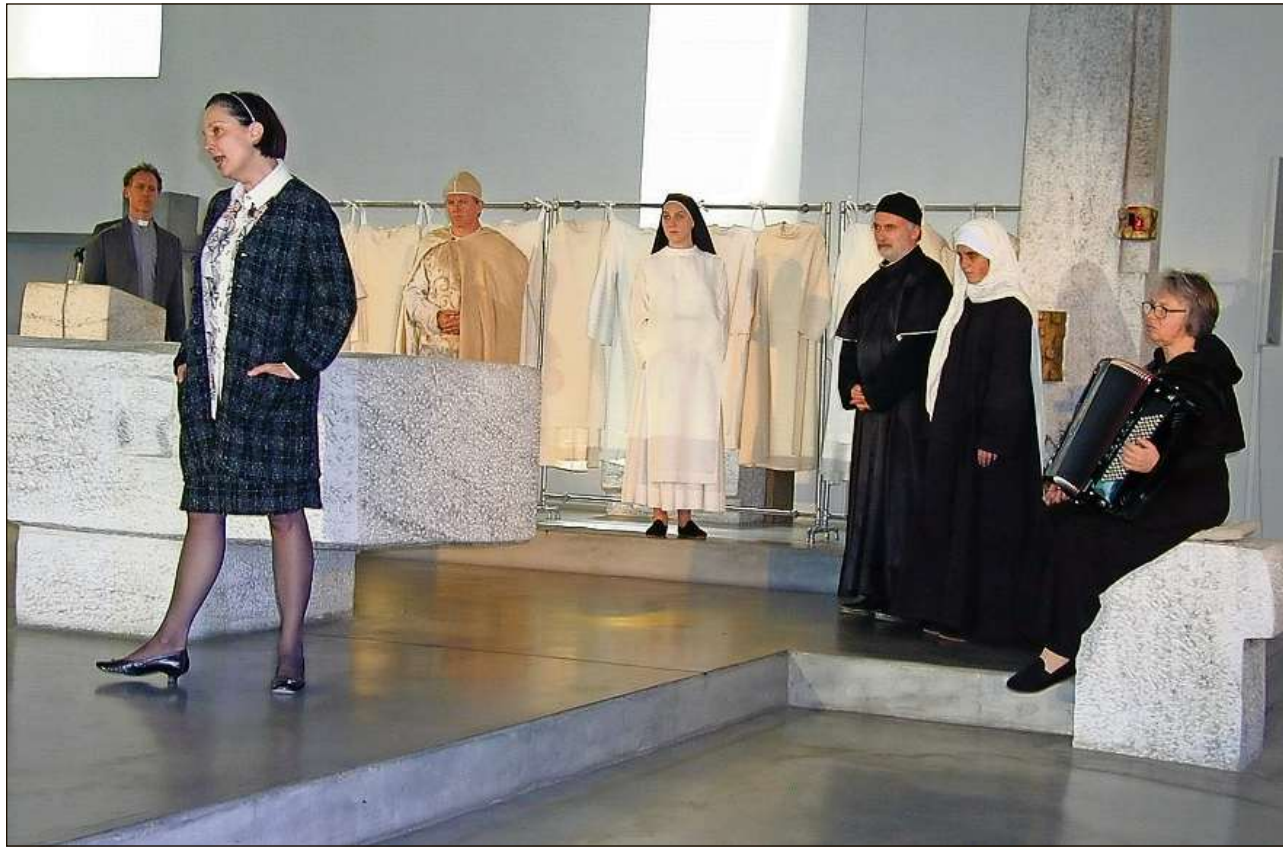
Acturs ed acturas fan serius patratgs co ei duei ir vinavon egl avegnir cun las claustras.

Quella damonda provoconta ei vegnida discutada vehementamein e fetg contravers durent l'emprema staziun dil te-